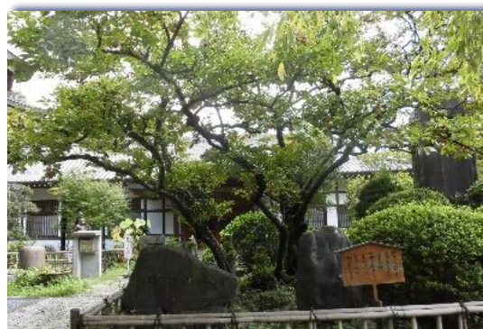
王禅寺境内 『禅寺丸柿の原木』

また、私達が日頃大変お世話になっている「 ごみ処理施設 」と処理作業を見学し、環境問題について改めて考えてみましょう。