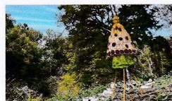
立川 真理子 「はじまりのはじまり」